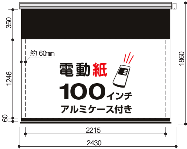
電動紙・アルミケース付 100インチワイド ( DSCW-100)